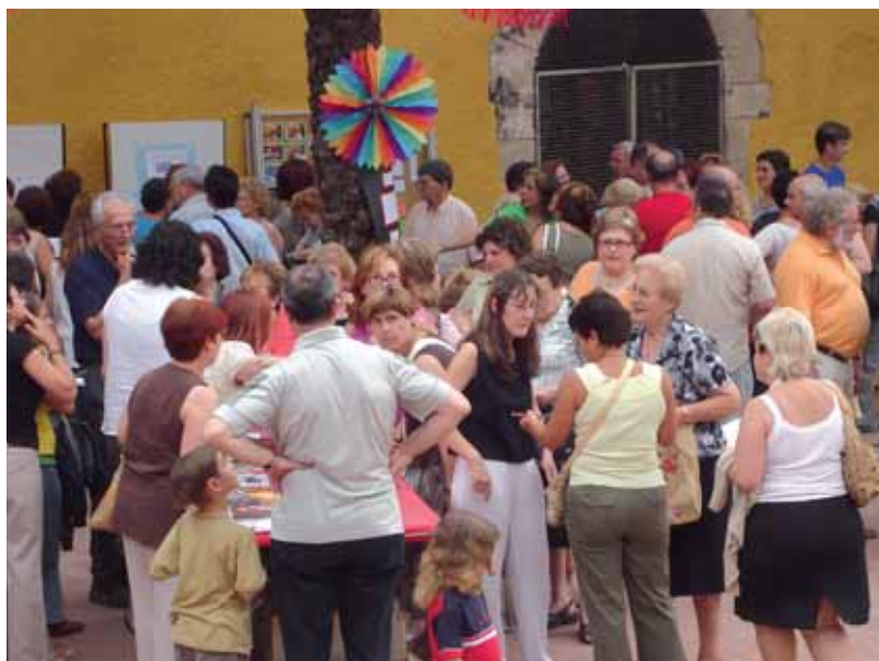
Moment festiu de la trobada de VxL del CNL L'Heura (Santa Coloma de Gramenet)

El "Voluntariat per la llengua" és un programa en ple ascens. Aquest 2007 ha crescut més d'un 40% i les perspectives de futur encara són més bones.