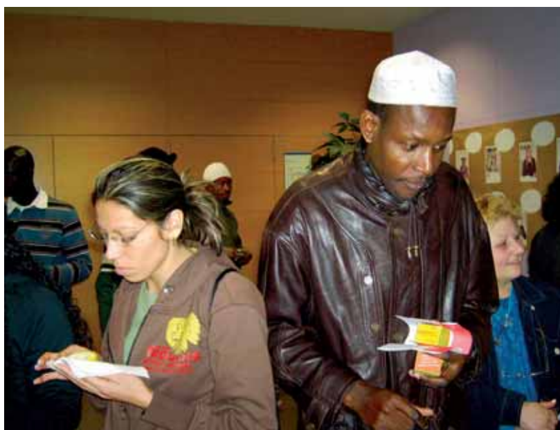
El “Voluntariat per la llengua” apropa les cultures

“El VxL és un bon programa, molt creatiu i senzill de dur a terme: només cal una mica de temps i voluntat”