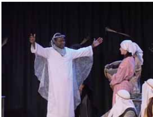
Representació dels Pastorets del CNL d'Osona (Vic)

“El VxL ha estat una oportunitat de conèixer una nova cultura i fer noves amistats”