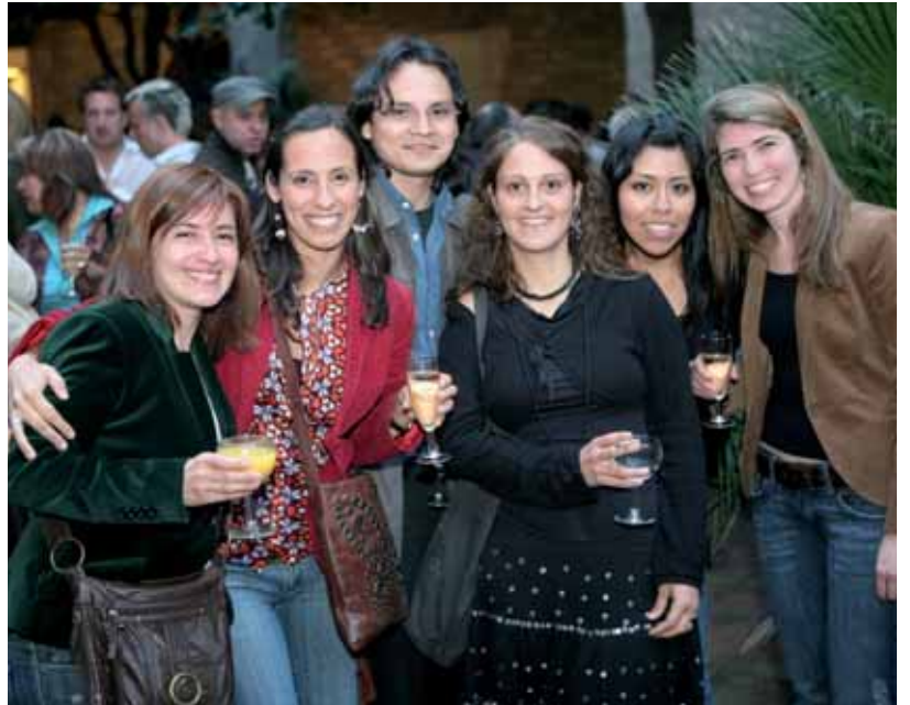
El "Voluntariat per la llengua" apropa les persones

funcioni. També fan un seguiment de les parelles i al final de les trobades en recullen les opinions per veure què cal millorar.