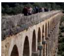
Trobada de parelles lingüístiques del Maresme i Tarragona

El futur passa per... Les previsions de futur indiquen que durant el 2008 es podrien duplicar el nombre de parelles formades el 2006. Això implicaria arribar a les 8.992 parelles constituïdes, xifra possible d'aconseguir tenint en compte la solidesa i implantació del programa.