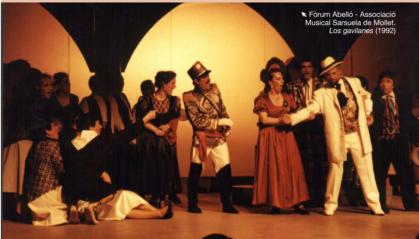
► Fòrum Abelló - Associació Musical Sarsuela de Mollet. Los gavilanes (1992)

Sembla que la sarsuela de peix pren el nom de la sarsuela musical, tot i que no se'n sap el motiu. Potser és perquè en aquest gènere musical s'hi barregen parts cantades amb altres de parlades, igual com en el plat hi ha molts elements diferents barrejats. O potser ve del fet que, igual com