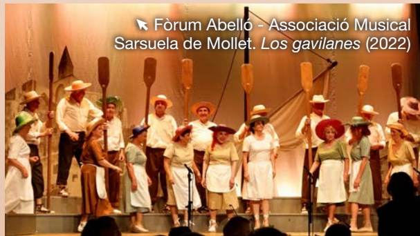
Fòrum Abelló - Associació Musical Sarsuela de Mollet. Los gavilanes (2022)

Nota sobre el tractament de dades personals