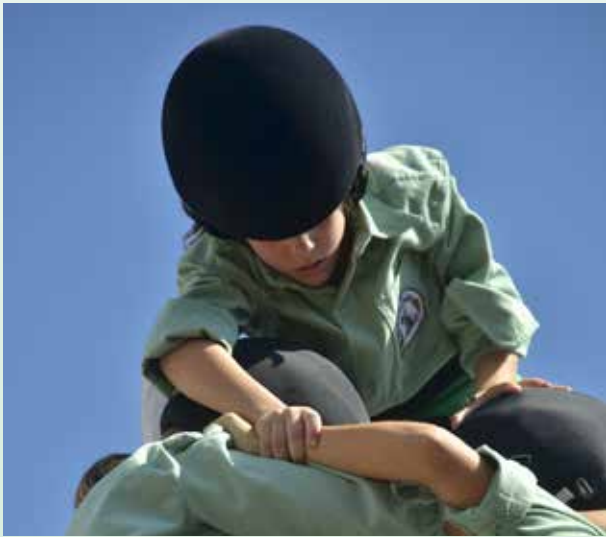
Acotxador col·locant-se damunt dels dosos.

Gairebé a tot el Vallès, anomenem torre el castell de dues persones a cada pis del tronc, però en altres parts del territori casteller, o segons la colla, el mateix castell també es pot dir dos . Aquests sinònims són molt habituals en el lèxic casteller. Així, la canalla també s'anomena mainada ; l' acotxador o acotxada –el casteller o castellera que és just a sota de l'enxaneta– també és aixecador o aixecadora i, de vegades, cassoleta ; els vents –els membres de la pinya que subjecten la cama dreta d'un casteller o castellera i l'esquerra d'un altre–, també són mà-i-mans i daus ; i els contraforts –la persona que es col·loca just darrere del baix–, també són homes o dones del darrere , entre d'altres.