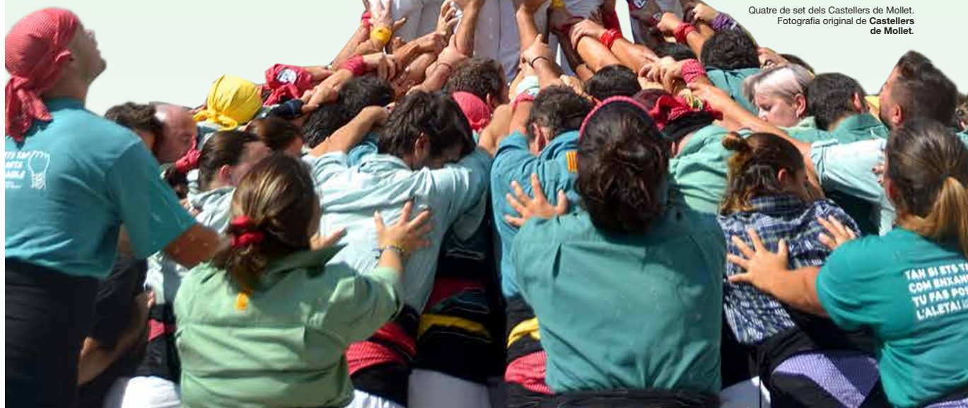
Quatre de set dels Castellers de Mollet.

Aconseguir que un castell tingui la simetria correcta entre els diferents pilars que el formen.