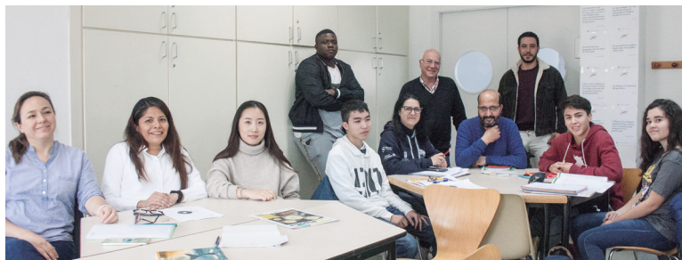
Alumnes de català d'una de les classes que, al desembre de 2019, va col·laborar en un especial Nadal