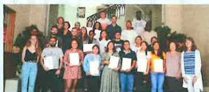
Foto de família de l'entrega dels certificats.

L'Ajuntament ha entregat, aquest dilluns, el Certificat d'Acollida i el Certificat Implica't a Sitges a 34 persones novingudes de nacionalitats ben diverses. El programa Implica't a Sitges, del Servei de Primera Acollida, és un paraigua sota el qual s'ofereixen diverses formacions, principalment sobre aspectes clau de la societat catalana i sitgetana, amb l'objectiu d'oferir informació sobre la vila i facilitar la integració. Dins d'aquest procés de formació s'inclouen 90 hores de cursos de català, impartits pel Consorci de Normalització Lingüística.