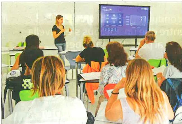
Una classe d'un dels cursos a Sitges, aquest dijous.

Els cursos de llengua catalana incrementen la seva demanda entre les persones novingudes, que s'hi apunten majoritàriament per motius legals i laborals